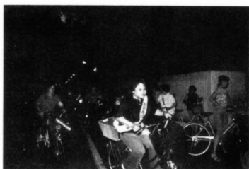
ふれあいパトロール