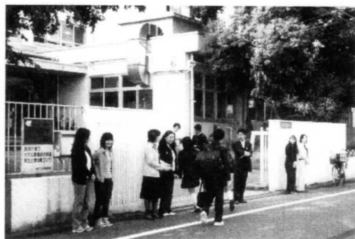
朝のあいさつ運動

います。 そして、最もご紹介したいのが、「朝のあいさつ運動」です。朝の登校時間に保護者が学校の前に立ち、子供たちにあいさつで迎える活動です。かつて荒れていた時代にどうしたら子供たちが明るく学校に来て楽しく過ごせるだろうと考えてスタートした活動です。この活動を始めたとした保護者の関わりにより子供たちは落ち着きを取り戻し現在の葛西第三中学校へとつながっています。 また、夏休みの期間中は、夜間8時より、「ふれあいパトロール」を実施しております。これには地域小学校PTAの協力も貰いながら、地域を巡回し帰宅を呼びかけたり、中学生以外にも声掛けを行う等、安心・安全な環境を作る活動を続けております。 この様に、葛西第三中学校は地域とともに歩み40周年を迎える事が出来ました。これからも私達PTAは地域の皆様と手を取り合い、生徒たちを明るく照らし、その望ましい未来を見つめられるように活動したいと考えています。よろしくお願ひします。