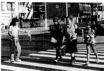
登校時を見守る「旗持ち活動」

日頃より、新田町会の皆様には新田小学校PTAの活動に多大なるご協力を頂きまして有り難うございます。新田小学校は、昨年開校30周年を迎えました。新田町会の皆様から沢山の祝辞を賜りましたこと厚く御礼申し上げます。 本校は、ブルーガーデン、新田コミュニティ会館、新左近川親水公園、新田の森公園と、豊かな水と緑に囲まれた素晴らしい環境の中で子ども達が日々成長していく姿に、この地域で子育てが出来て良かったと感じております。 新田小PTAでは、「全員参加のPTA!!」をかげ、「子ども達の為に何が出来るか」を考え、保護者全員が何らかのPTA活動を行ってまいります。登校時を見守る旗持ち活動、新田フェスティバル出店、夏休みラジオ体操、新田町会盆踊り出店、ふれあいパトロール、学校行事のお手伝い等の活動に参加、また22回目となりました親子まつりでは、お父さん会名物かき氷や新田うどん、バルーンアート、スタンラリー、キャンドル&空気砲作り等々、子ども達の喜ぶ手作り感いっぱいのお祭りとなり、お陰様で大盛況の中終える事が出来ました。 新田町会の皆様には、子ども達が感謝や思いやり、またあたたかい心を持ち、さらに笑顔でいられる様、私共保護者にもご指導頂き、今後も変わらぬPTA活動へのご理解・ご協力を賜りたくお願い申し上げます。