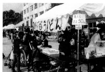
親子まつり名物「新田うどん」