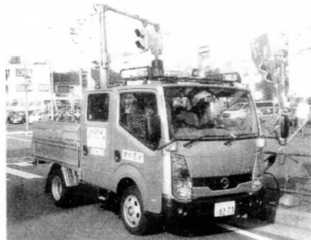
ニッサンアトラス(ダブルキャブ車) 排気量1,990CC、定員6名(黄色燈・広報スピーカー装備)※念願のエアコンも装備され、運転席からの視界も良好となりました。

8月に10年以上使用した先代の広報車を新車と入れ替えました。これから防犯パトロール他町会活動においてに活用いたします。