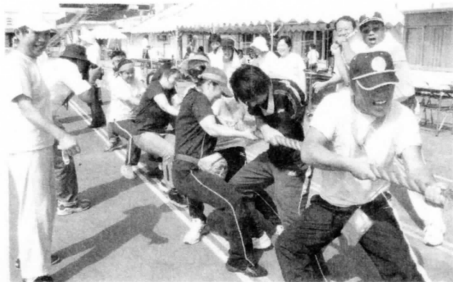
綱引きチーム！力の限りがんばりました。