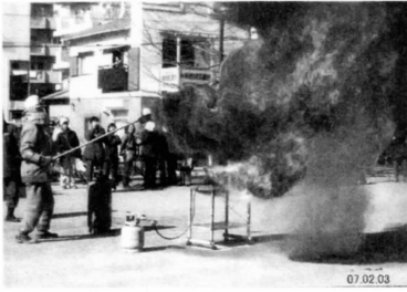
「油火災は水で消さない」