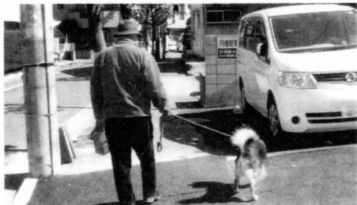
“犬の散歩でのフン始末”