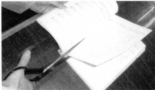
“図書館の本の切り取り・落書き”