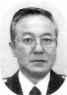
葛西警察署長 今給黎 達郎