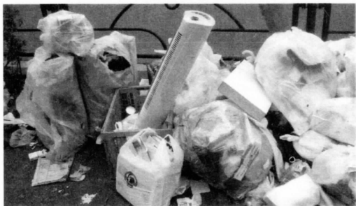
“ゴミがゴミを呼ぶ”