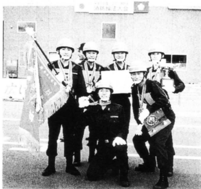
江戸川消防団第十一分団

今日、子供たちの地域への帰属意識の低下が問題にされています。新田フェスティバル等の地域行事を通して自分の住む町を自覚できる子に育って欲しいと願っています。