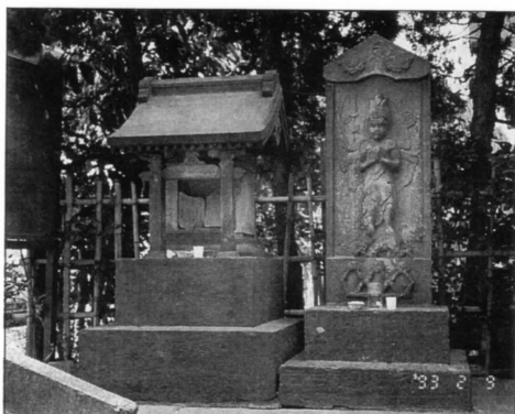
▶葛西駅前、正應寺角に祀られている庚申塔の石仏

水と縁の深い葛西は、その水の恩恵で生業をたててきた。又、最も怖れたのも水難の災いであった。今でも路傍にたたずむ庚申塔には、人びとの幸福と長寿を願う気持ちがこめられている。誰が手向けたのか、赤飯と水と酒が供えられていた。そこに息づくふるさとを見た。